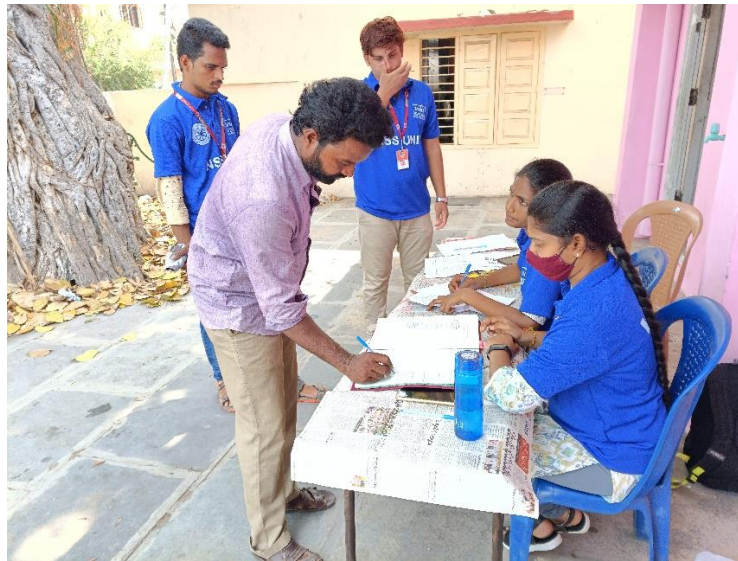
Pic: Registration counter for training program