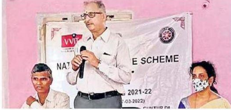
చిలువూరులో జరిగిన సదస్సులో మాట్లాడుతున్న శాస్త్రవేత్త కేవీ సుబ్రహ్మణ్యం