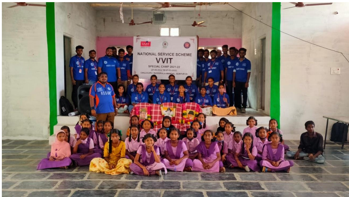
Pic: Remembrance of Late Sri Bhagath Singh