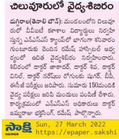
Pic: Sakshi Telugu news paper clipping