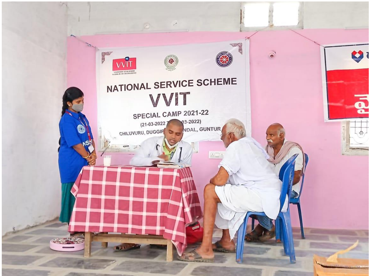
Pic: Doctor consultation point in the camp