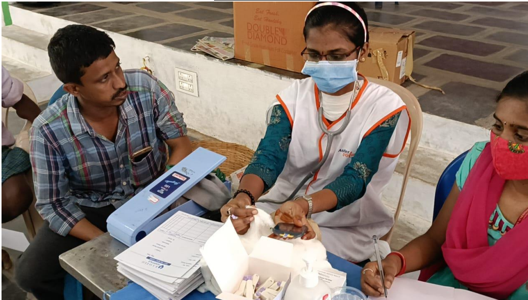
Pic: BP and Sugar checking point