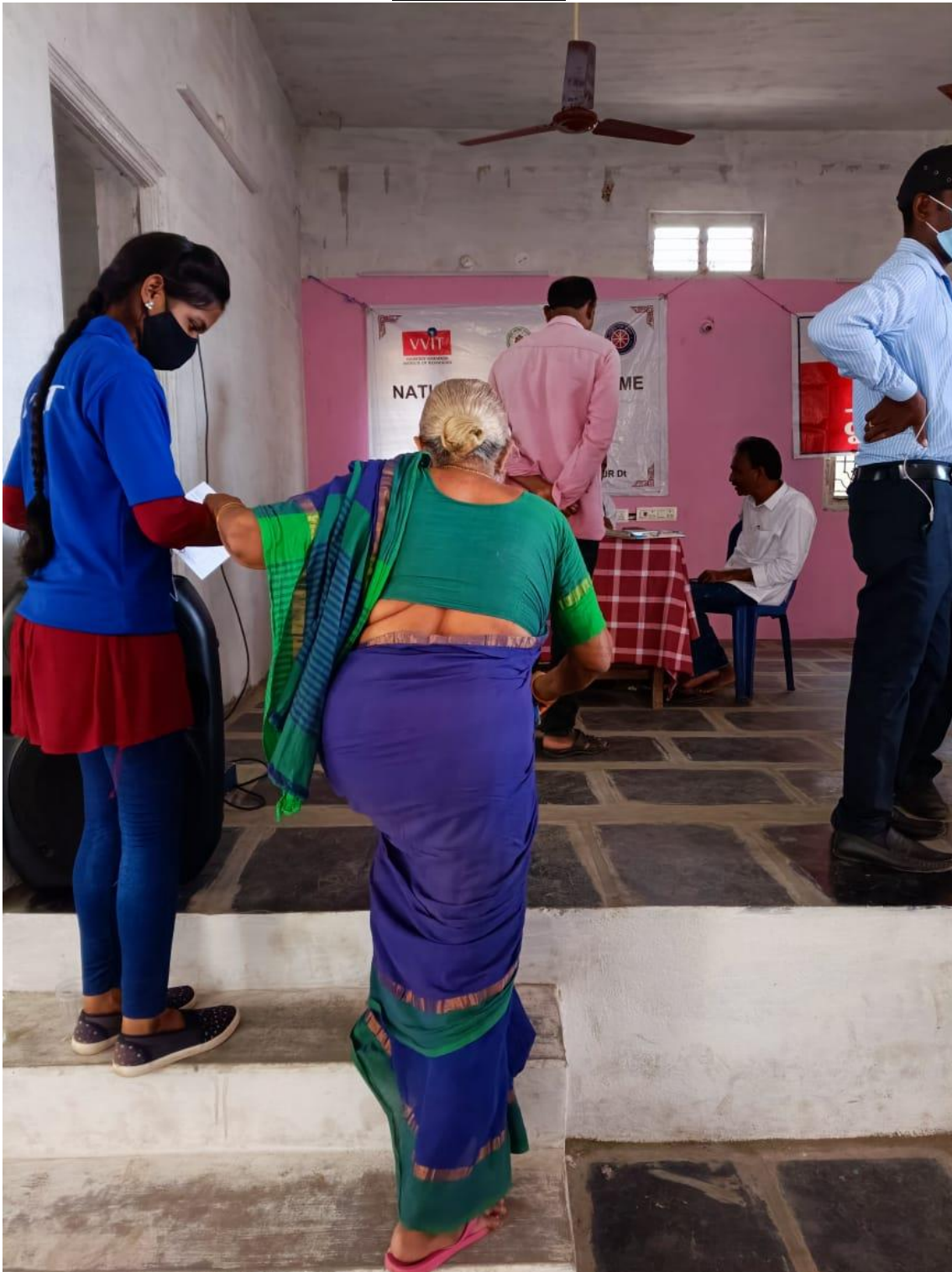
Pic: NSS volunteer's service in the camp