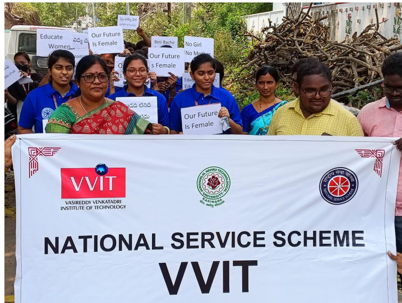
Pic: Rally started by MDO