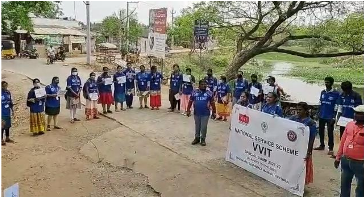
Pic: Manavaharam at chiluvuru