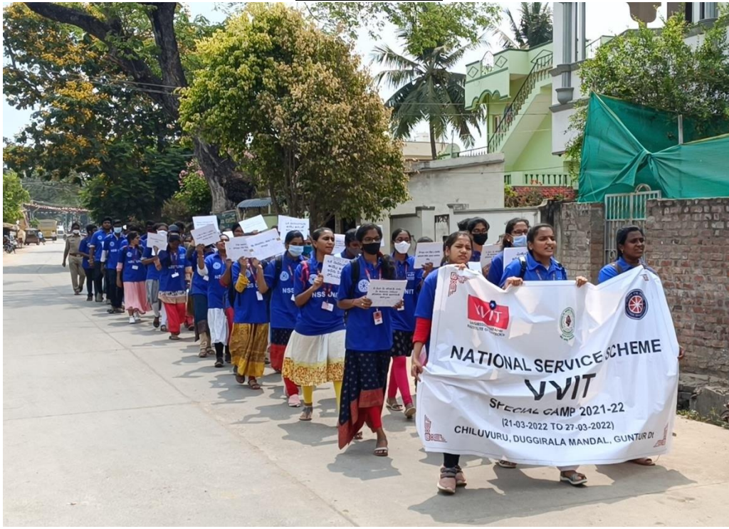
Pic: Rally with slogans