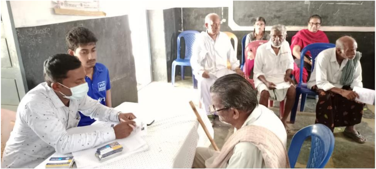
Pic: Consulting the doctor regarding eye issue