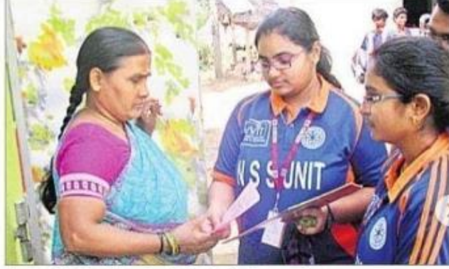
ప్రజలకు పథకాలపై అవగాహన కల్పిస్తున్న విద్యార్థులు