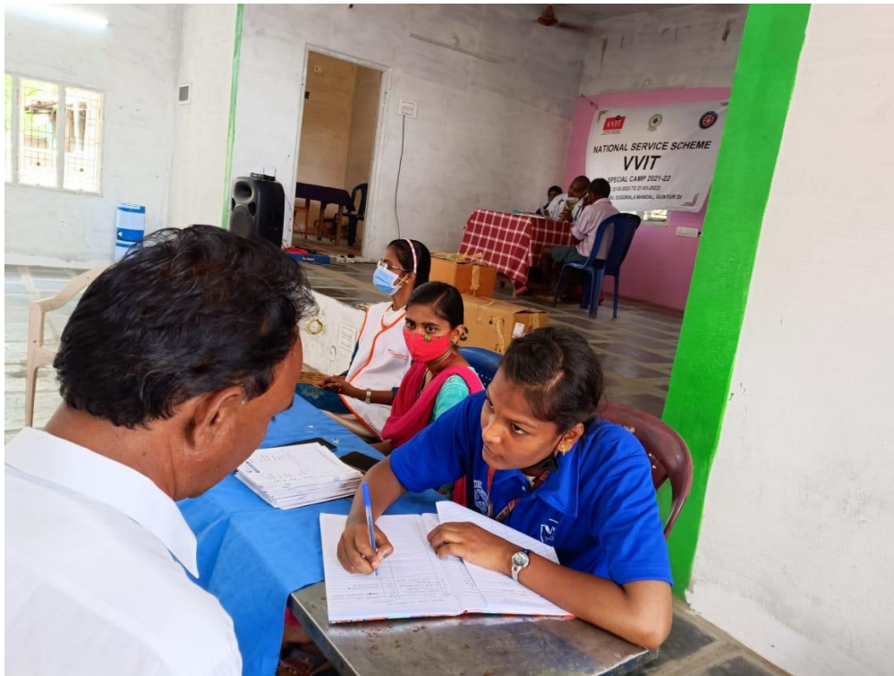
Pic: Reception and OP point