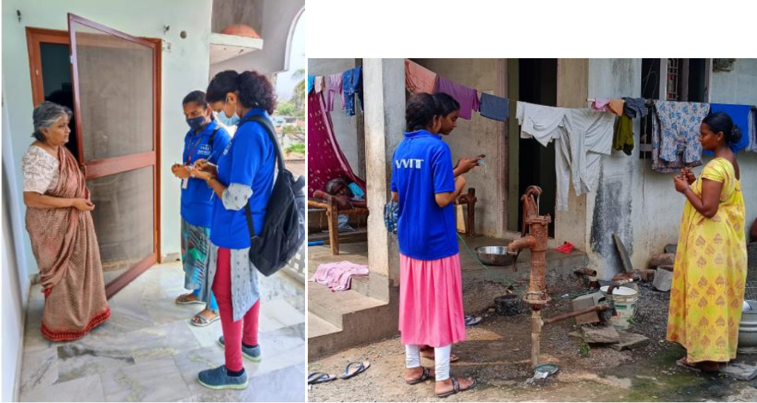
Pic: Door to door campaigning