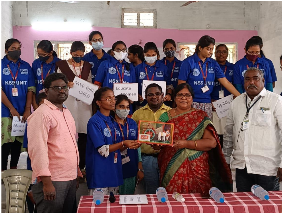
Pic: MDO honored by VVIT NSS unit.