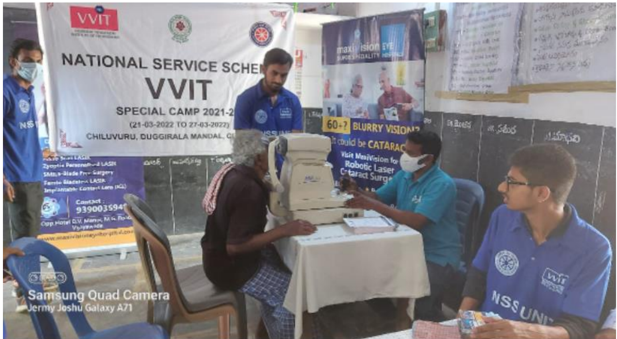
Pic: Eye check up