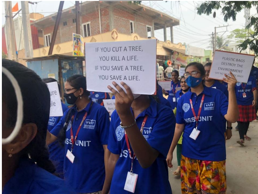
Pic: Rally on importance of plantation and avoid plastic