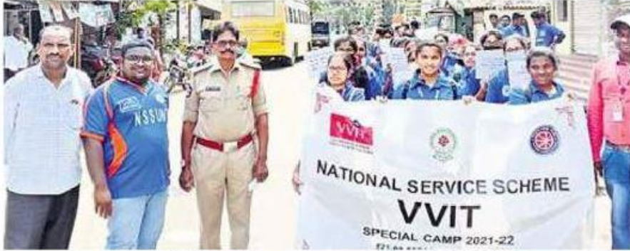
చిలువూరులో ర్యాలీలో పాల్గొన్న నంబూరు వీవీఐటీ ఎన్ఎస్ఎస్ విద్యార్థులు