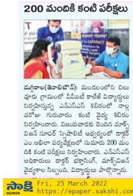
Pic: Sakshi Telugu news paper clipping