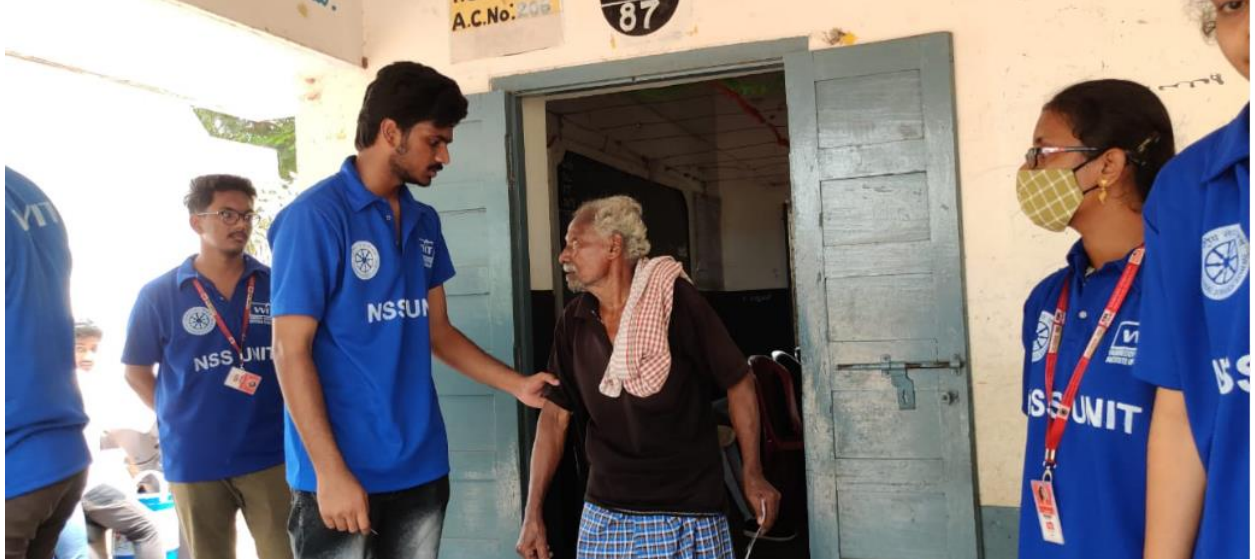
Pic: Guiding the old poor man to his house after eye check by NSS volunteer